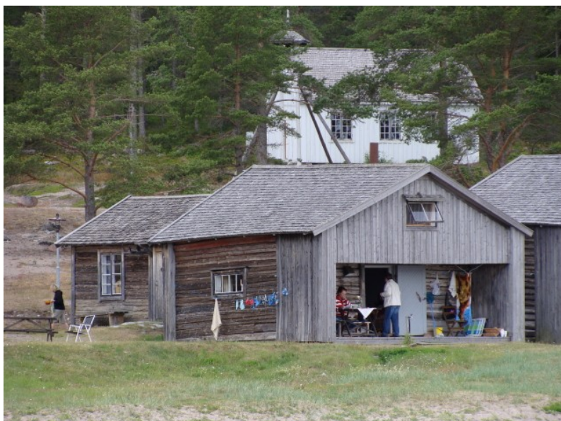
En af de meget charmerende ferieboliger ved Şandviken

Şå var det frem med cyklerne. Vi skal nemlig til Şandviken i den modsatte ende af øen. Vi var ikke klar over det, men Şandviken var faktisk et kulturhistorisk område. Şandviken bestod af ca. 12 hytter, hvor Gävle fiskerne havde haft deres sommerbopæl. Disse fiskere var kommet med hele familien, geder og får og havde slået sig ned her på Ūivön i sommer halvåret, hvor de så havde fisket.