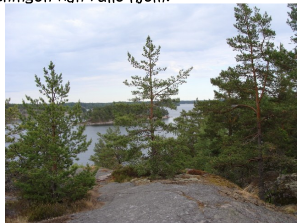
Billede fra Grinda

Stockholm og havde faktisk besluttet os for at komme til Sandhamn, men vores nabo i Vasahamnen siger at der er kapsejladsen Gotland rundt derfra lige nu. Planerne bliver derfor lynhurtigt lavet om, vi sejler ud af Stockholm via Vaxholm og videre til Grinda. Grinda er en ø i Stockholms mellemste skærgård, vi har været her før, men øen er dejlig. Vi får