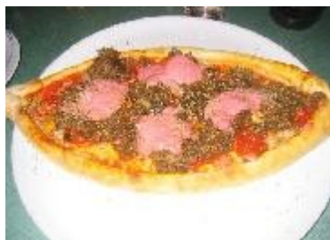
Laplands pizza - det lyserøde er lingön (tyttebær)

Aftensmaden måtte så blive den lokale specialitet som var Laplands pizza.