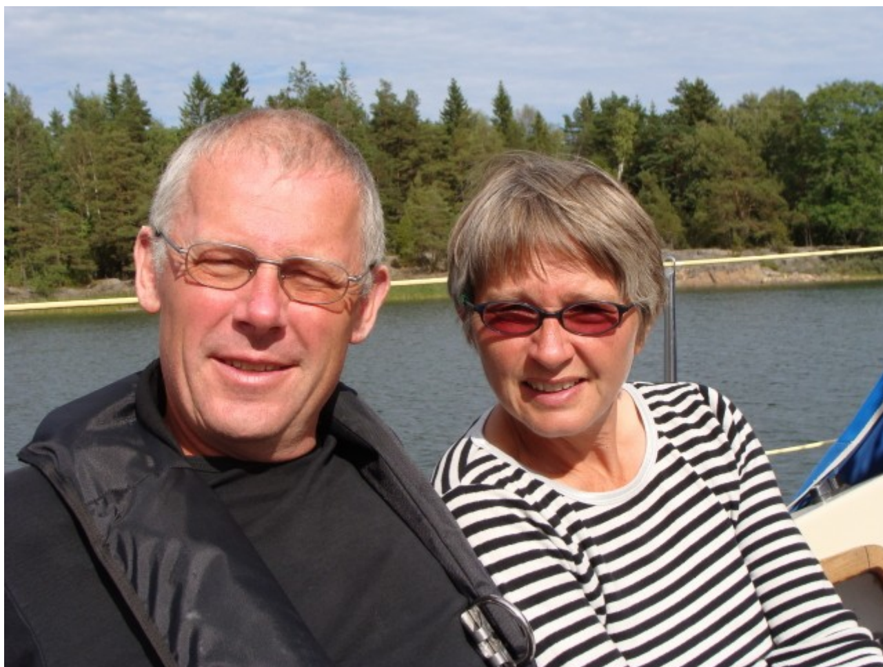
De krumbøjede ex IFere