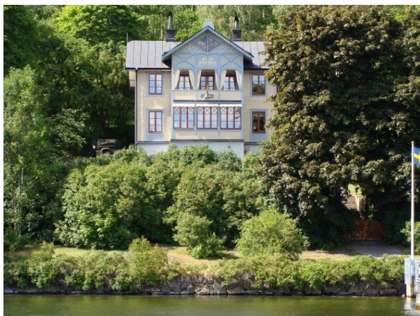
Huse af en vis standard forekommer her ved strædet

200 -250 sek pr. person, men sidenhen har det "kostet" 2 gange orlov af 4-5 måneders varighed – to både - så lyt til et godt råd tag aldrig til skærgården med turbåd.