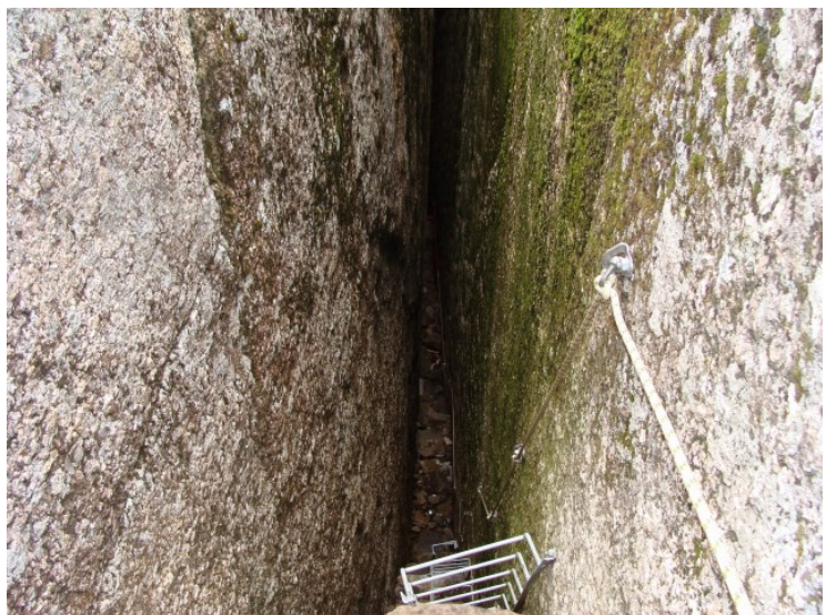
Lidt billeder af grotterne på god afstand