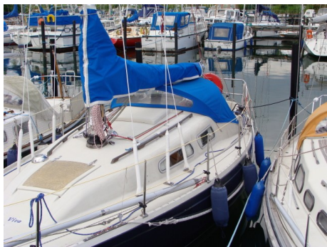
Viva i Lynetten

Balladen Viva nåede vi lige at overtage og inden starten af vores tur har vores "sejlerfaring" i denne båd været en sejlads helt fra Lynetten til Svanemøllehavnen.