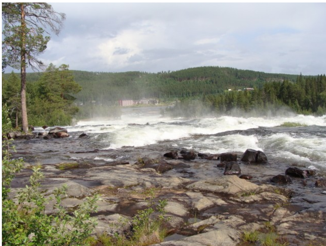
Storfossen - den er meget imponerende i virkeligheden

som danskere betages af. Rejerne mødes på landevejen, man skal være lidt vågen på disse 110 km/t landeveje når rejerne pludselig kommer ud på vejen. Vi ser mange