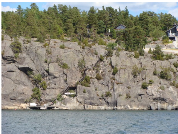
Indsejling af Ingaröfjärden

I 1997 var vi på camping i Stockholm og sejlede med turbåd fra centrum til yderskærgården, nærmere betegnet Sandhamn. Turen var vel ikke så dyr en ca.