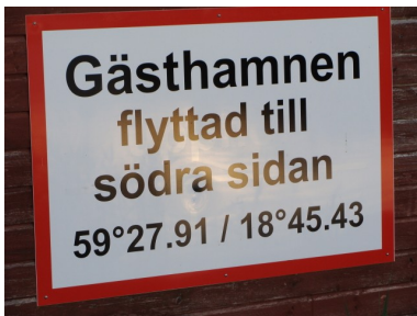
Flytning af havne foregår også her

Vi sejler lidt rundt i dag, det virker som om navigatøren har taget lidt ferie. Først ud og så ind så lidt rundt og så lidt mere rundt. Da vi beslutter os for at gå i havn er vi på den forkerte side af øen og vi må sejle en time ekstra for at kunne komme ind i havnen uden hjul. Men så er det også en skærgårds idyl vi oplever på Ingmarö. Lige som vi har lagt os ind i havnen kommer den