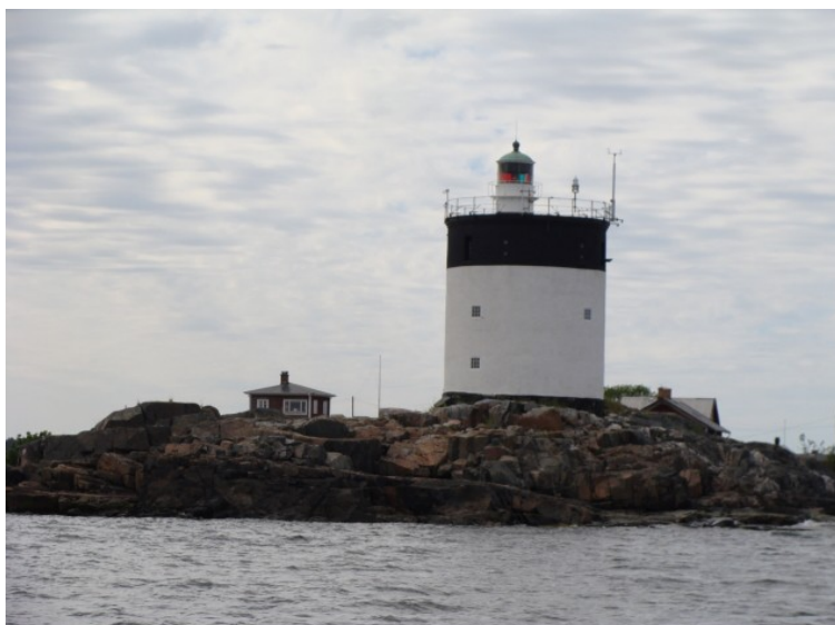
Indsejling efter Singö

Næste dag tager vi videre. Denne dag kommer vi faktisk nordligere end vi nogensinde har været. Vi vælger at sejle udenskærs fra Graddö til omkring Singö hvor vi igen går ind i skærgården. Det var faktisk lidt rart at sejle en 20 -25 sømil bidevind (tæt på vinden) sejlads, men det viste os også hvordan sommeren indtil videre har været. Inden vi havde sejlet ret meget var vi iført fuldt sejlgarderobe i form at