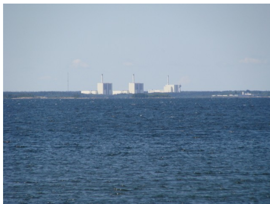
Forsmark ved Öregrund