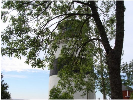
Djursten fyr på Gräsön

Sverige har man Vägfarer -alle dem vi har set har været malet gule – og de sejler gratis personer og biler mellem fastlandet og de lidt større skærgårds øer.