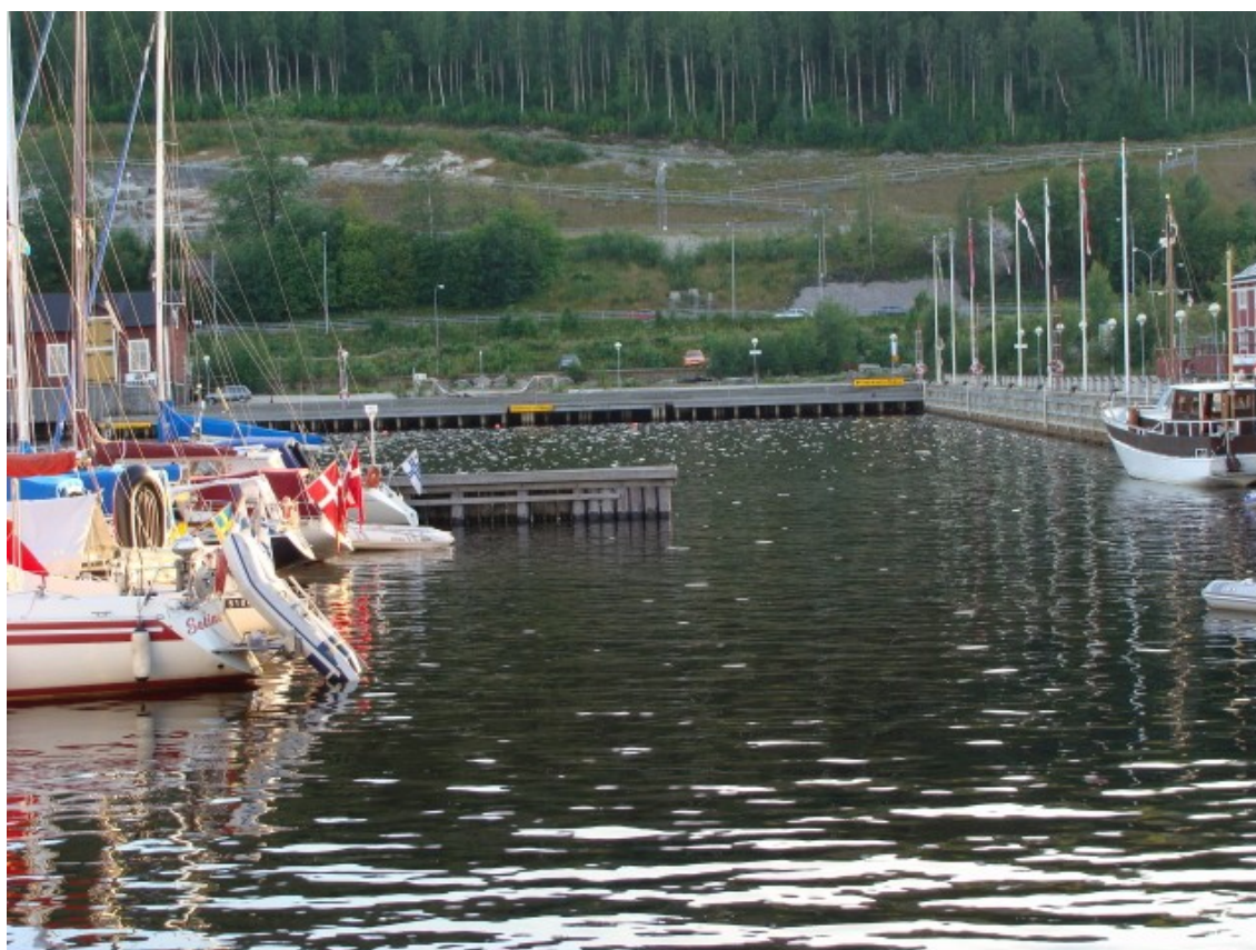
2 danske både side om side i Ö-vik

Örnsköldsvik har vi også nået at kigge lidt nærmere på, blandt andet fra