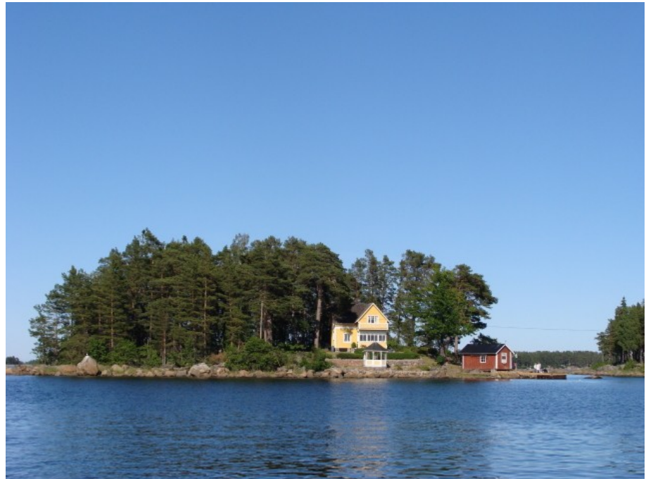
Mere fra den rigtig flotte skärgård

Da vi nåede frem til Segelvik var vejret bare så flot – 20