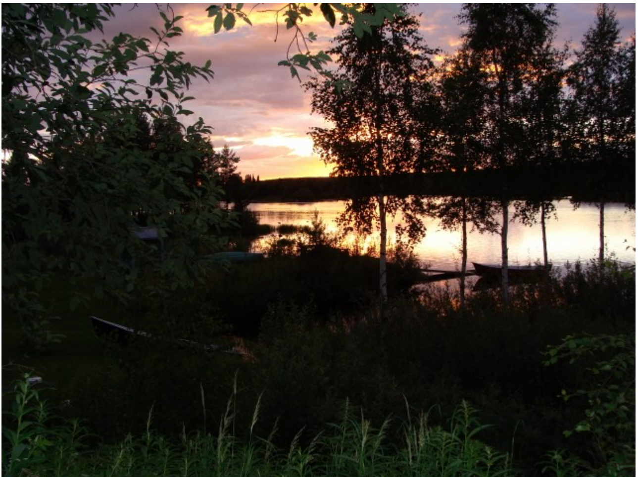
Udsigt for vores stuga - myggene er derude

har mange træer det kan man ikke. På hele turen fra Örnsköldsvik var der næsten overalt træer og træer alle vegne. Fantastiske view giver det når man kommer kørende ad snorlige veje. Velankommet til aften i Jokkmokk finder vi en stuga der udlejes, og så begynder den vilde jagt ind til Jokkmokk inden forretningerne lukker for vi skal nå at handle i dag. For hvis der er en ting Sverige har i større