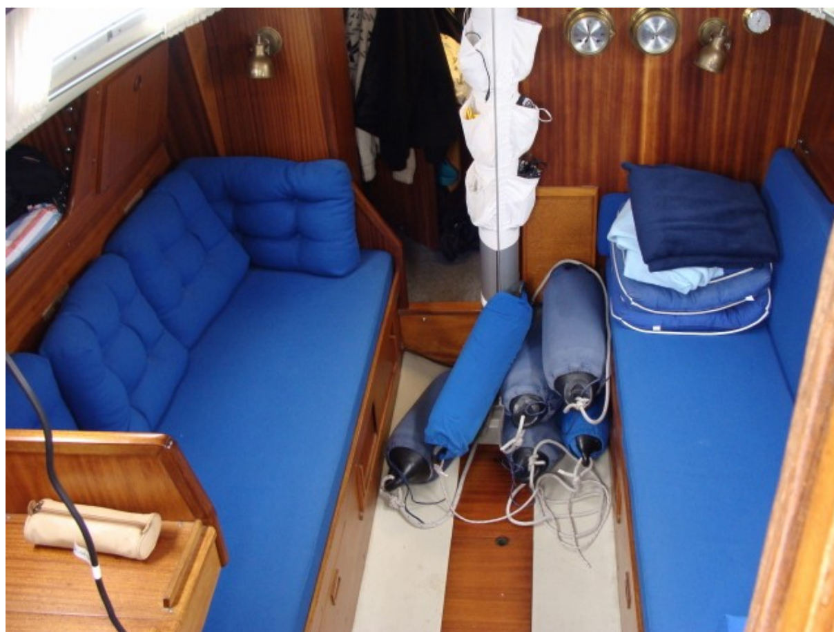
Indretning af Viva under pæn rolig sejlads