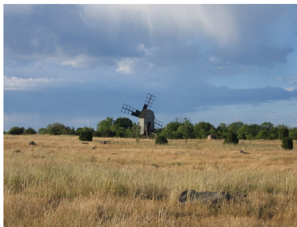
Typisk mølle på Öland

Vi spænder med det samme cykelspænderne på og tager ud i den ølandske natur ad Ølandsleden – og vi fik hurtigt kørt en 25-30 kilometer på småveje – og fik et godt indtryk af den ølandske natur. Vi fandt aldrig købmanden på turen og derfor gik turen til cafeen på havnen. Den var dog reserveret til et 60 års kalas, men vi fik lov til at sidde på