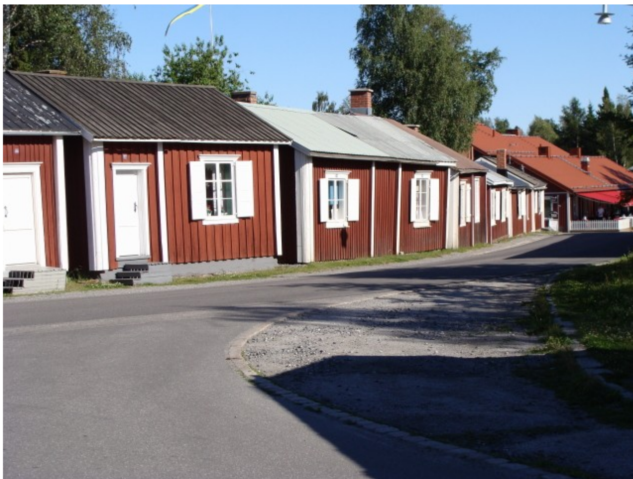
Kirkebyen ved Luleå - Fantatisk

Der var og er forbud mod at benytte udenfor kirkeperioderne. En meget interessant by og kirke som er medtaget i verdensarven.