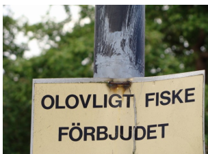
Ting kan være meget forbudt i Sverige

begge sider. Vi cykler lidt i omegnen, men vejret er ikke rigtig