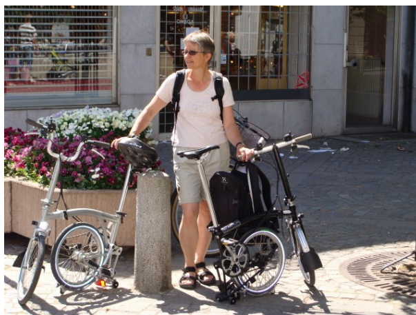
Brompton og Birgit

Meget blæst – ingen sejlads – cykler gode – mange gear rigtig godt. Dertil kommer også at han finder ud af der er bakker i Sverige, og så kommer historien igen. I disse situationer skal han bare have ret.