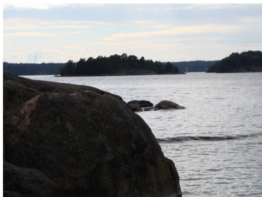
Lidt billeder fra Grinda

Det viser sig nemlig at tyven havde været på besøg på hans båd og taget en flaske sprit (ikke helt fuldt), hvad den finske bådejer opdagede, da han kom tilbage for et toiletbesøg. Vi kan råde alle til at lave være med at stjæle sprit fra en finne – det er ikke levetidsforlængende.