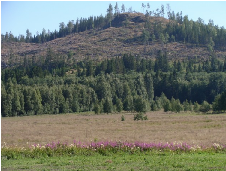
Skønne billeder ved Barsta