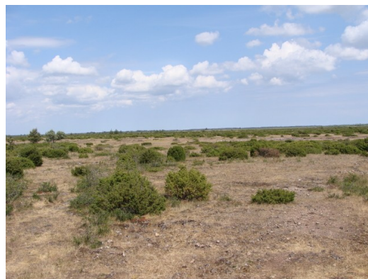
Alvaret på Öland

landskabstype der kun findes på Öland og i Estland dækker omkring 25% af Ölands areal. Og Öland er faktisk rimelig stor med sine 140 kilometer i længde og op til 15 kilometer bredde. Alvaretet er en sandstenslette