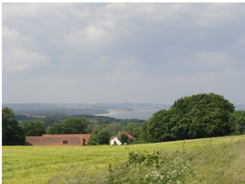
View ved Stenshuvud

Vi cykler til Kivik, med den ene æbleplantage efter den anden. Hvor må der dog være smuk hernede i april maj måned, når æbletræerne springe ud. Det siges at hovedparten af Sveriges frugtproduktion kommer herfra. Vi ser Æblets hus,