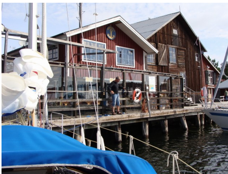
Mellemfjärden efter vores finske nabo var sejlet. Bemærk afstanden til restauranten