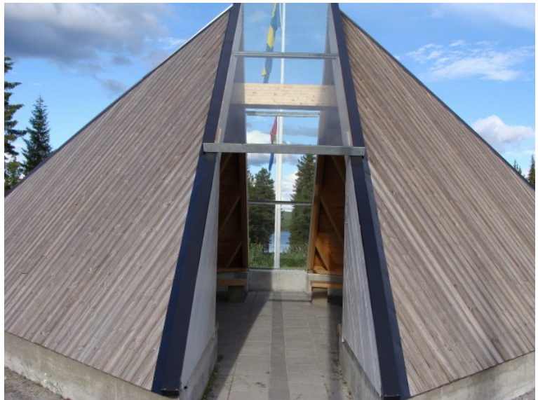
Polarcirkel opbygning - mon den flyttes med cirklen

Vi havde talt om at køre helt til Harparanda, men i Luleå besluttede vi at tage til Jokkmokk – en by lidt nord polarcirklen mest kendt for deres samermarked i februar måned. Vi nåede ikke at se midnatssol, da vi kom herop ca. 14 dage for sent, men det var ikke mange timer at solen var væk mens vi var her. Turen gik fint og man kan sige meget om Sverige, men tage fra dem at de