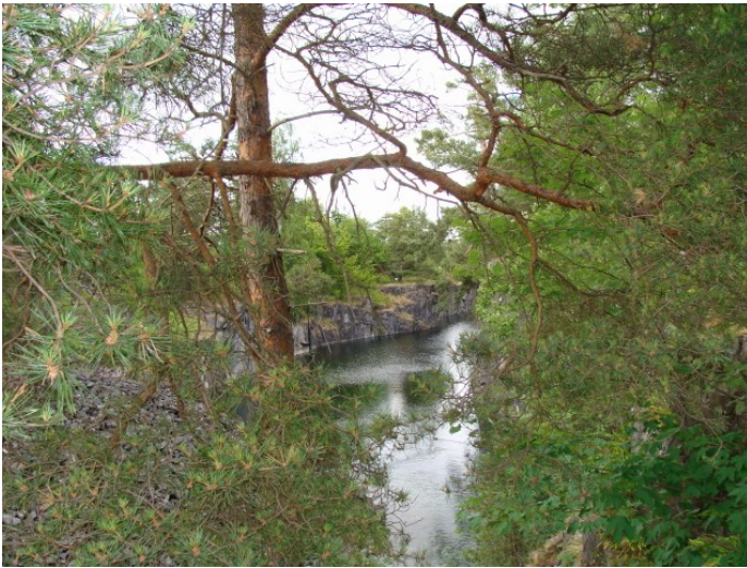
Det åbne malmbrud