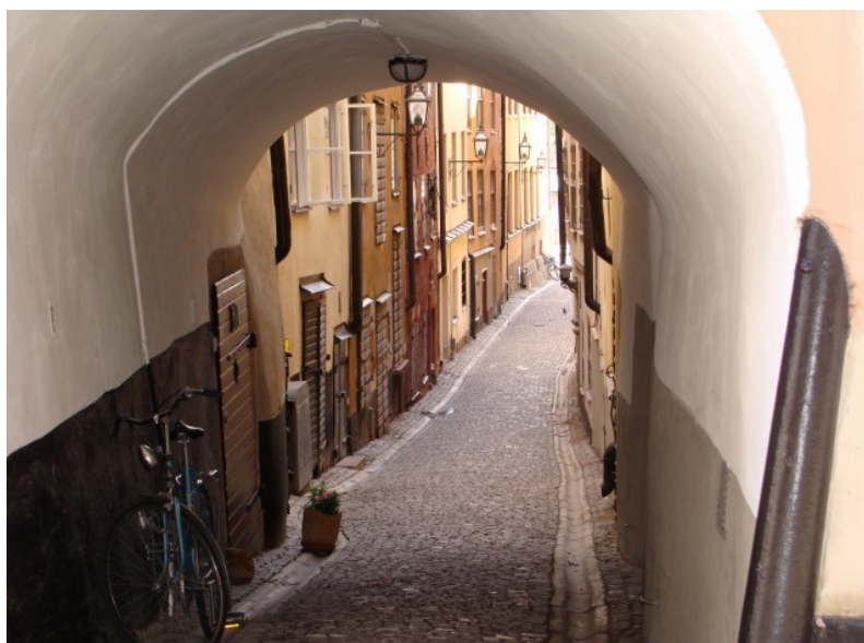
Gamla Stan i Stockholm