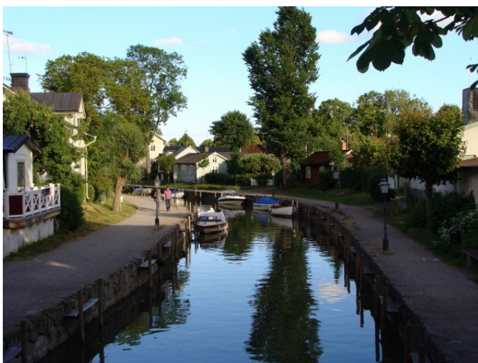
Åen i Trosa

Igen i dag blæser det også meget til eftermiddag og vi stryger afsted på denne midsommeraftens dag 20 juni. Det er svensk fridag i dag, så alle svenskerne har fået sat blomsterkrans i håret, støvet bådene af og så er de alle sammen kommet afsted – unge som gamle. En stor fest er det og man undres over at den blomsterkrans kan blive siddende.