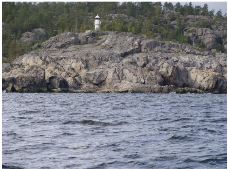
Runding af Harnö

Vi sejler fra Hanösand til Barsta – et lille fiskeleje. På vejen hertil sejler vi ind i