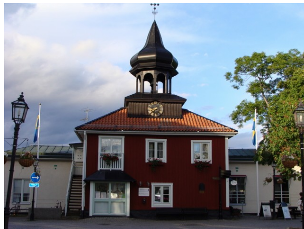
Rådhuset i Trosa

Trosa er en dejlig by og vi besluttede hurtigt at her må vi bruge en dag ekstra. Trosa er opstået rundt om åen og har en masse gamle hyggelige træhuse. Trosa kaldes også for verdens ende, men det er der vel rimelig mange steder der kaldes. Havnen er rimelig stor og hele åen benyttes som havn på