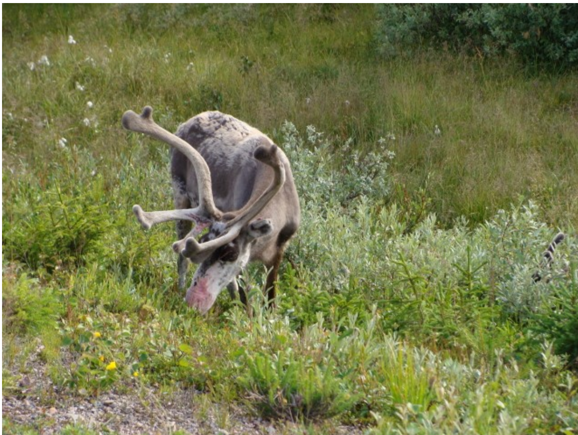
Reiner var der mange af

Vi kører næste dage retur mod Örnsköldsvik og ser en del af det Lapland som vi