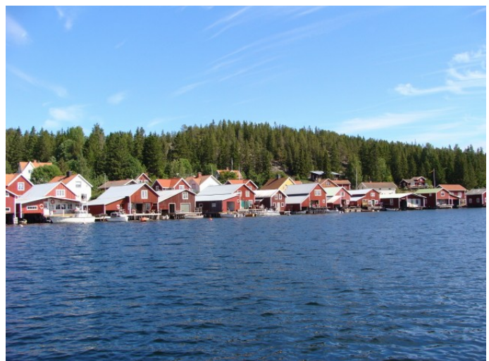
UIVön med den flotte havnefront