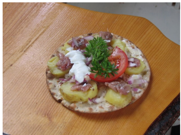
Og sådan ser maden ud

Han fortæller, forklarer og viser - hvordan den kolde surstrømming skal filetteres, skæres i småbider, lægges på en kartoffelbund af varme kartofler som ligger på Norlandsk knækbrød smurt med smør. Ovenpå dette lægger man rødløg, tyrkisk youghurt, lidt tomatskiver og måske lidt