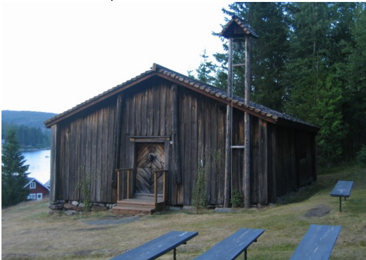
Kapellet ved Barsta. Udendørs foregår det også her

noget mosekonebryg og her glædes vi over vores kortplotter. Da vi 1 til 1½ time senere kom ud af brygget viste vi helt præcist hvor vi var og det det havde vi selvfølgelig også vist mens vi var inde i ærtesuppen. Resten af dagen gik i pragtfuldt solskin og da vi er kommet i havn, kører vi os en cykeltur og får gået en vandringsstur i omegnen. Det er flot og meget bakket, og øjet betages bare den ene gang efter den anden. Der lyder hele tiden se her og der, og vi fotograferer og fotograferer, men må hele tiden erkende at det menneskelige øje er sådanne fotolinser stærkt overlegne. På vores cykeltur ser vi også en større rovfugl i nærheden af vejen, arten nåede vi desværre ikke at artsbestemme. Vi nyder det skønne sted og glæder os allerede nu for i morgen tager vi formentligt til UIVön.