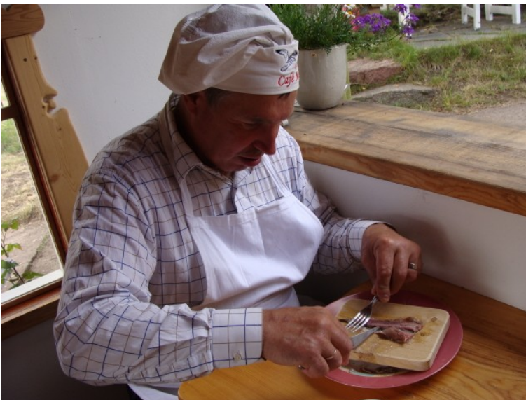
Og så renses "fisken"

persille. Spis det med fingerne som værten sagde, hvis man spiser med kniv og gaffel sidder man jo fremover bøjet, men hvis du spiser med fingrene sidder du med rank ryg og du kan bedre kommunikere med de andre ved bordet. I den hele taget var han virkelig skæg og interessant, og han opnåede at gøre hele dette måltid til en rigtig god og lærerig oplevelse. Man vi kan sige en ting – lugten af disse surstrømming var ubeskrivelig. Smagen var bedre og det kunne sagtens spises, selvom det nok ikke er en ret vi