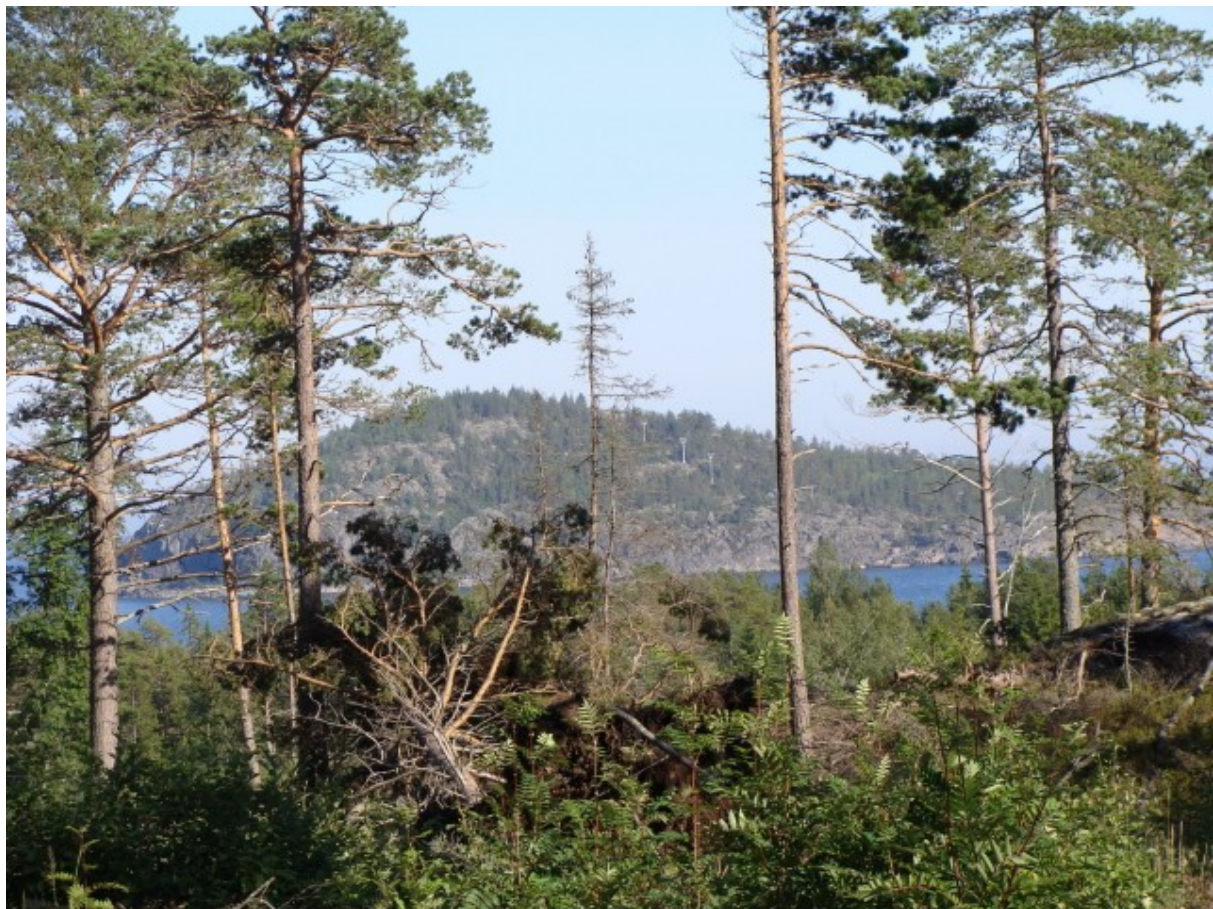
Den skønne område ved Barsta