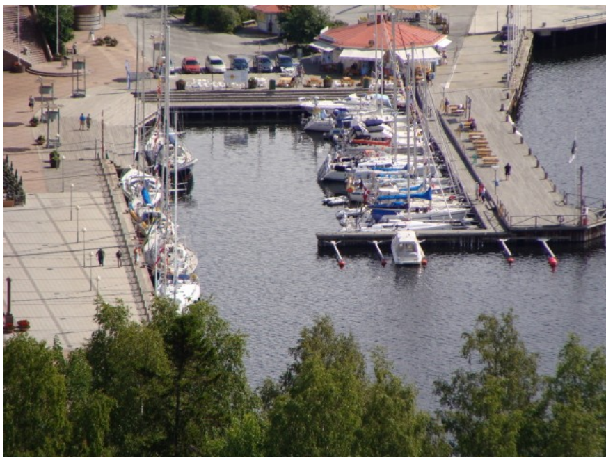
Havnen set fra Varvsberget

Afskærmning til beskyttelse mod bølger udefra og dønninger fra forbisejlende både findes som regel ikke. Samtidig findes der i Sverige rigtigt mange motorbåde, og ejerne af disse tager ikke så meget hensyn. Det var vist nok en grov generalisering, men effekten er, at man tit ligger meget uroligt i de svenske havne.