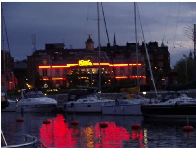
Sundsvall og kasino ved aftenstid

Fra Mellemfjärden sejler vi til Sundsvall – den af meteorologerne lovede syd til sydøstlige vind blev erstattet af en nordøstlig vind, så der var et dejlig friskt kryds på en 25 sømil. Der var masser af plads derude, så det var faktisk helt fint. De